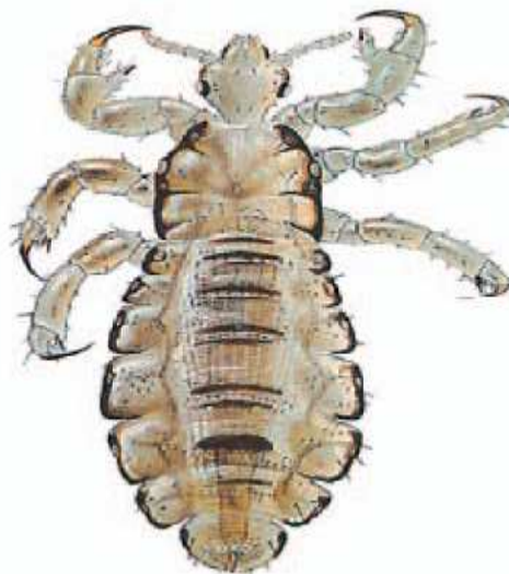
dorosły samiec wszy