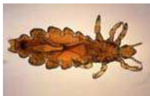
Dorosły osobnik wszy