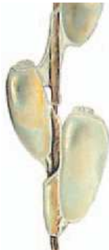
Jaja wszy (gnidy) przytwierdzone do włosa