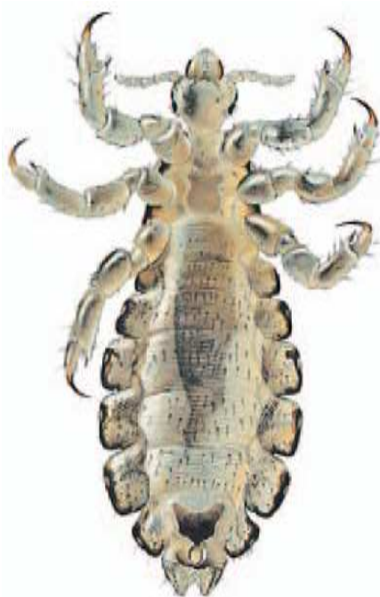
dorosła samica wszy

Wszawica (łac. pediculosis) jest chorobą spowodowana przez obecność na ciele człowieka pasożyta – wszy główowej ( Pediculus capitis ). Wszy żyją wyłącznie na owłosionej części skóry, żywią się krwią człowieka. W miejscu ugryzienia powstaje odczyn zapalny skóry, który powoduje uczucie silnego świądu, a w konsekwencji drapanie się. Dorosłe osobniki osiągają wielkość 2-3 mm, są barwy biało-brązowej.